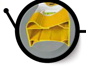
Extreem belastbaar profiel